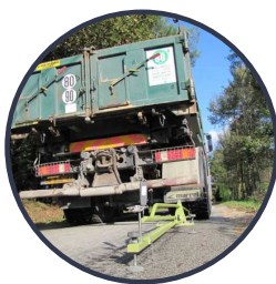
Poutre de Benkelman